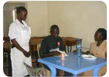
レストランでの接客の実習風景。サービスという考えを理解することから始める。

今号では、JCCPが南スーダン*およびケニアにおいて実施している経済的自立支援をご紹介します。