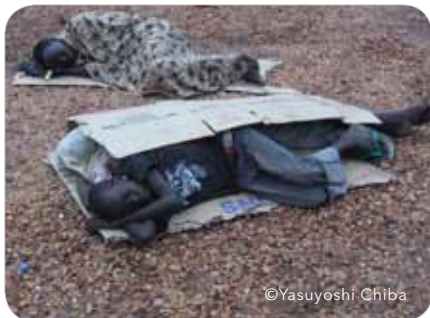
南スーダン：路上生活を余儀なくされる子供たち