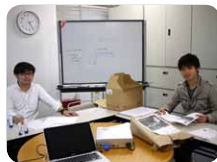
作業の間も会話が弾みました