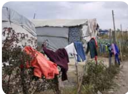
ケニア：ナクル市の避難民キャンプのテント