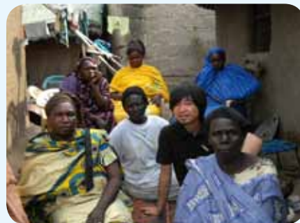
南スーダンBRACのマイクロファイナンスの顧客グループを訪問