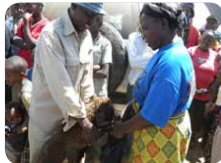
ケニア：家畜用のヒツジを受け取る避難民キャンプの住民