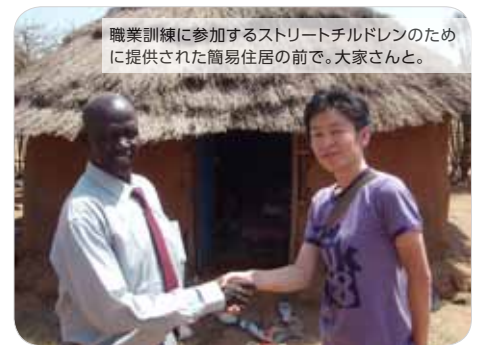
職業訓練に参加するストリートチルドレンのために提供された簡易住居の前で。大家さんと。

A: 現地職員の能力を向上させることです。一人一人の能力を見極め、自分たちでできることは極力自分たちでやってもらうようにしています。最終的には南スーダン人スタッフだけでできるようにするために私たちの活動によって最大限の効果が得られるように常に心がけています。彼らがその気持ちに伝えてくれたときは最もやりがいを感じます。